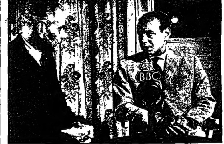
ومع الحسن الثاني ملك المغرب

طوقان ، وصديق اسمه جلال زريق ، والشاعر البارودي من حماد .. مؤرخة لثقافتنا الشعبية معهم فأجدوا وأبدعوا . قسمت طوران عن الوطن العربي